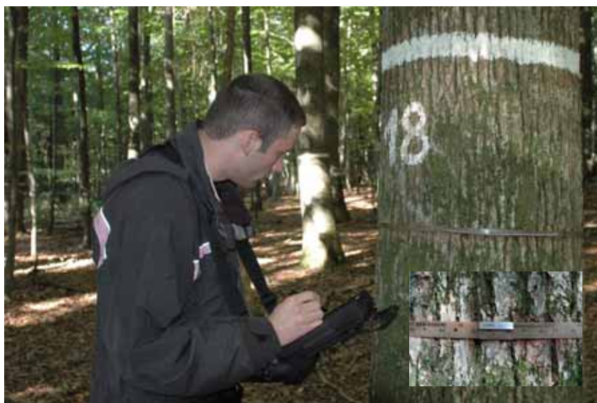
Ablesung eines Umfangmessbandes. Insbesondere zur Prüfung des Zusammenhangs zwischen Kronenzustand und Zuwachs sind die Bäume auf allen Dauerbeobachtungsflächen mit Umfangmessbändern bestückt

sind. Auf der anderen Seite ergab sich in der Mehrzahl der Studien, dass unter sonst vergleichbaren Bedingungen Bäume mit schlechtem Kronenzustand ein schlechteres Wachstum aufweisen als solche mit gutem Kronenzustand. Die Befunde der Wachstumsanalysen und der Kronenzustandserhebungen sind daher nur scheinbar widersprüchlich.