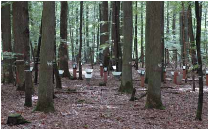
Depositions- und Streufall-Sammler an der Level-II-Fläche Merzalben im Pfälzerwald

Die Verbesserung des Wachstums der Waldbäume ist nach dem gegenwärtigen Kenntnisstand auf den angestiegenen CO 2 -Gehalt der Atmosphäre, die klimabedingt verlängerte Vegetationsperiode, die bessere Waldpflege, vor allem aber auch auf den Eintrag von Stickstoff aus dem Luftschadstoffausstoß zurückzuführen. Durch Übernutzungen in früheren Jahrhunderten waren viele Waldökosysteme an Stickstoff verarmt. Die Bäume nutzen nun die verbesserte Stickstoffversorgung für ein stärkeres Wachstum vornehmlich der oberirdischen Pflanzenteile. Das gesteigerte Wachstum geht aber vielfach mit einer unzureichenden Versorgung mit basischen Nährstoffen, Nährstoffgleichge-