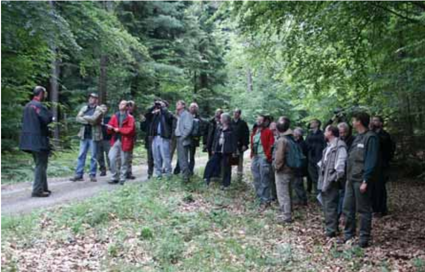
Die Inventurleiter der deutschen Bundesländer treffen sich jährlich zu einem Abstimmungskurs, um eine bundesweit einheitliche Kronenzustandsbonitur zu gewährleisten

konzept. Auf dem Raster der Kronenzustandserhebung wird im 15- bis 20-jährigen Turnus auch der Bodenzustand, die Bodenvegetation und der Ernährungszustand der Bäume aufgenommen und bewertet. Auf ausgesuchten Dauerbeobachtungsflächen werden zusätzlich andere Vitalitätsindikatoren wie Kronenstruktur, Zuwachs, Vorkommen und Vitalität von Waldbodenpflanzen und Flechten aufgenommen, sowie alle bedeutsam erscheinenden Einflussfaktoren erfasst. Der Zu-