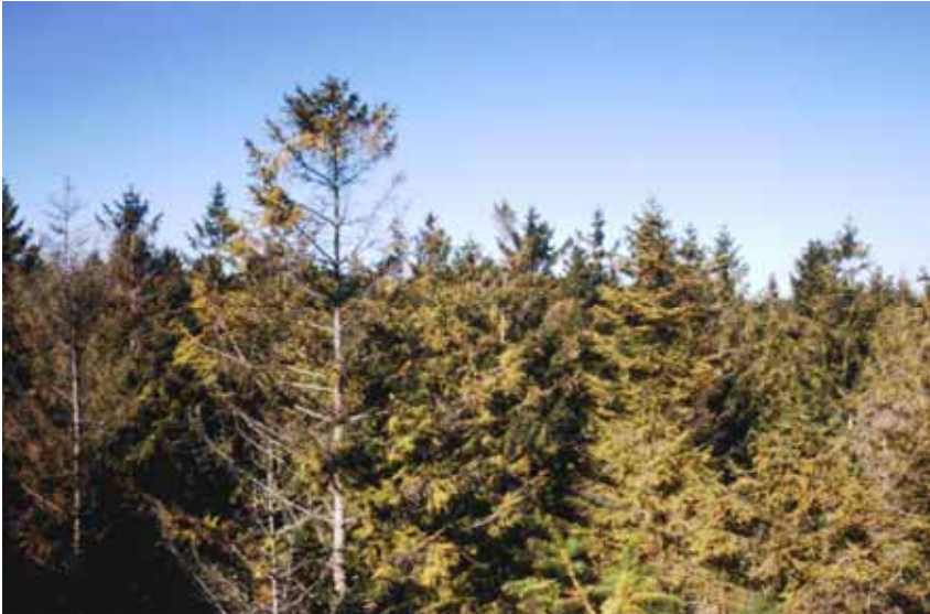
Infolge von Bodenversauerung und Magnesiummangel absterbende Fichten an der EU- Level-II-Fläche Hermeskeil/Hunsrück