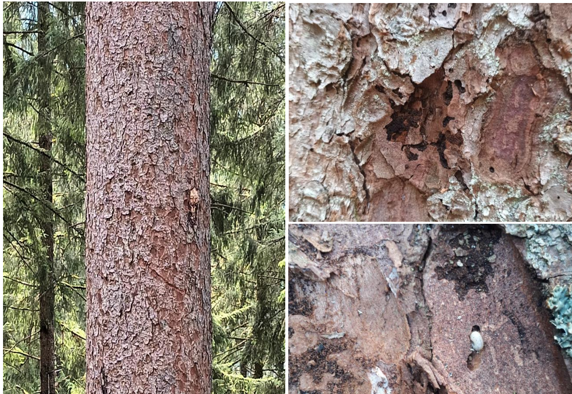
Abb. 3: Entwarnung, nur der Fichtenrinden-Nagekäfer! Links Fichte mit Spechtabschlägen – die jedoch in diesem Fall nicht auf eine Besiedlung des Buchdruckers, sondern des Fichtenrinden-Nagekäfers zurückzuführen sind. Für die Diagnose reicht ein genauerer Blick unter die Rindenschuppen; rechts unten ist eine Nagekäfer-Larve sichtbar.