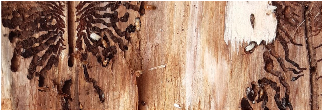
Abb. 2: Oben: Buchdrucker-Schwärmverlauf in den Monitoringregionen in Baden-Württemberg und Rheinland-Pfalz; Anzahl der Fallenstandorte in Klammern, Stand 35. KW = Flugwoche; weitere Details hier. Unten: Rasche Entwicklung der 3. Generation – der Blick unter die Rinde eines ab 09.08. besiedelten Brutbeobachtungsbaumes zeigt bereits Puppen und Jungkäfer ( ;)